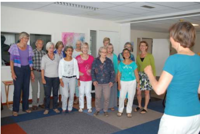
Ons koor Zingen voor je Leven

Ik ervaar aan den lijve hoe goed en fijn het is om te zingen, niet alleen samen in het Toon Hermans Huis Ede, maar ook thuis.... Dat gun ik een ieder, dus gewoon doen!"