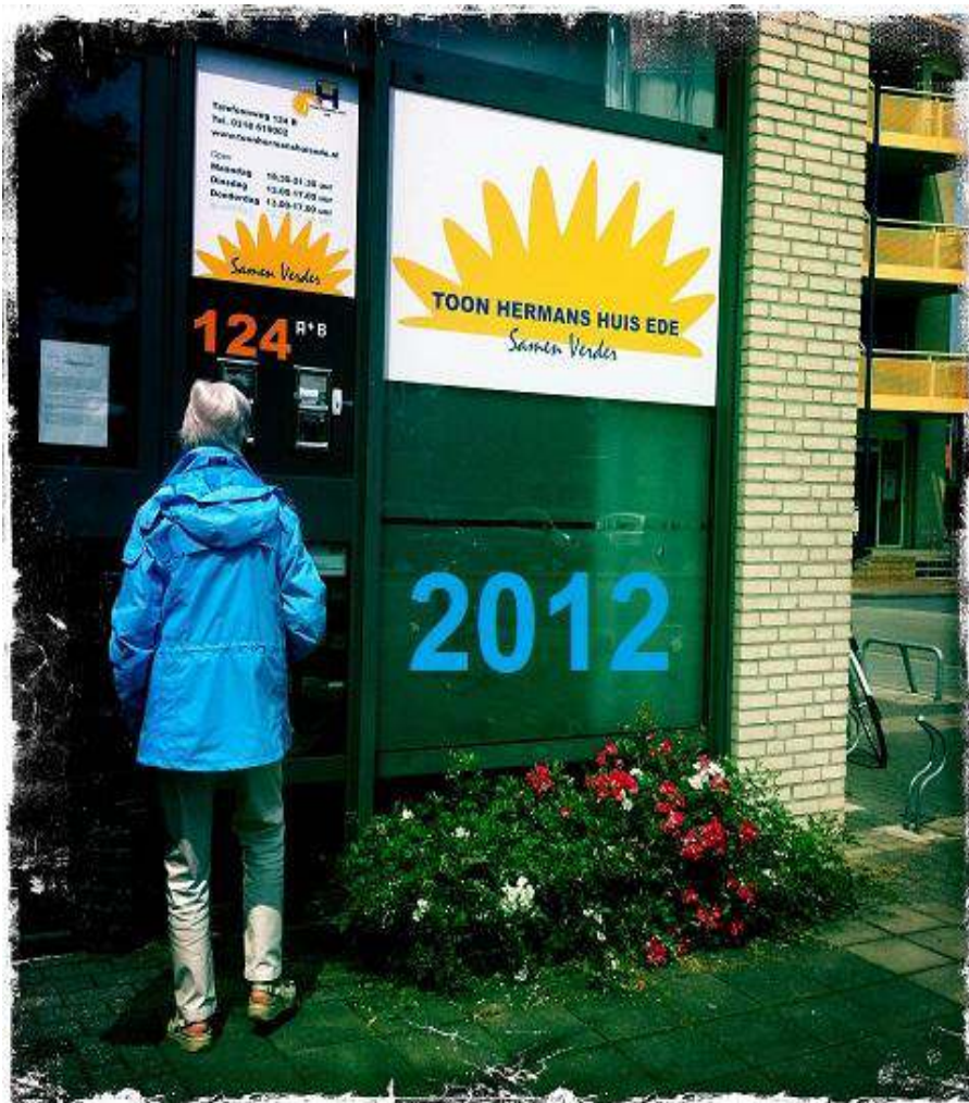
Jaarverslag Toon Hermans Huis Ede